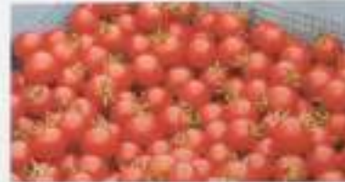
トマト・ジャガイトモ / 有限会社其清農場 (富良野市)