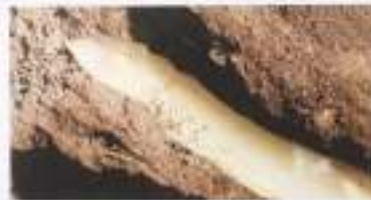
オサイトアスハラ-アンデローグ / 天心農場 (伊達市)