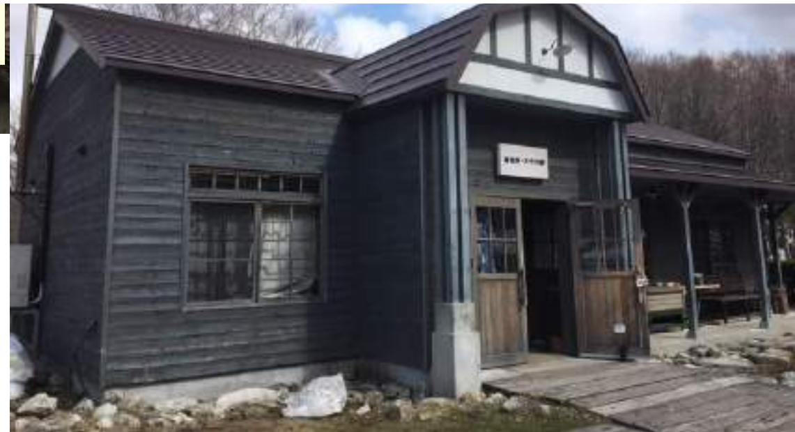
旧富良野駅の駅舎を再現した店舗