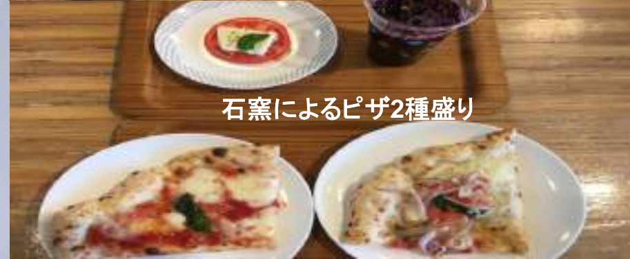
石窯によるピザ2種盛り