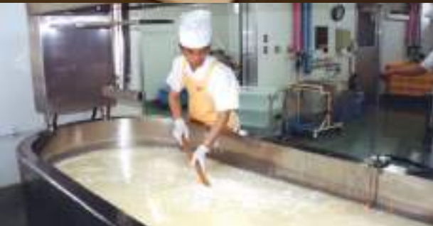
チーズつくり見学ブース