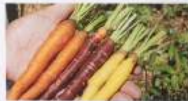
野菜・米 / 北野農園 (伊達市)