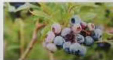
ブルーベリー・ハスカップ / 笑の屋農園 (富良野市)